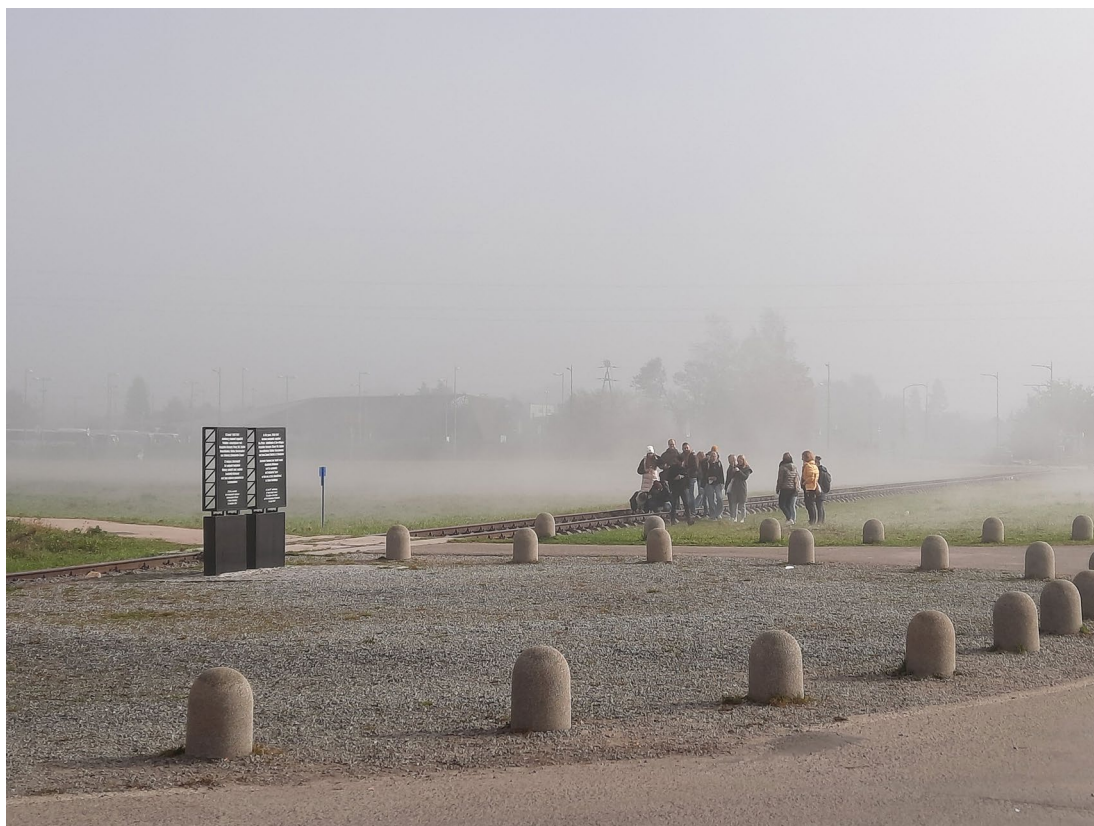
Besucherguppe auf dem Gelände von Birkenau