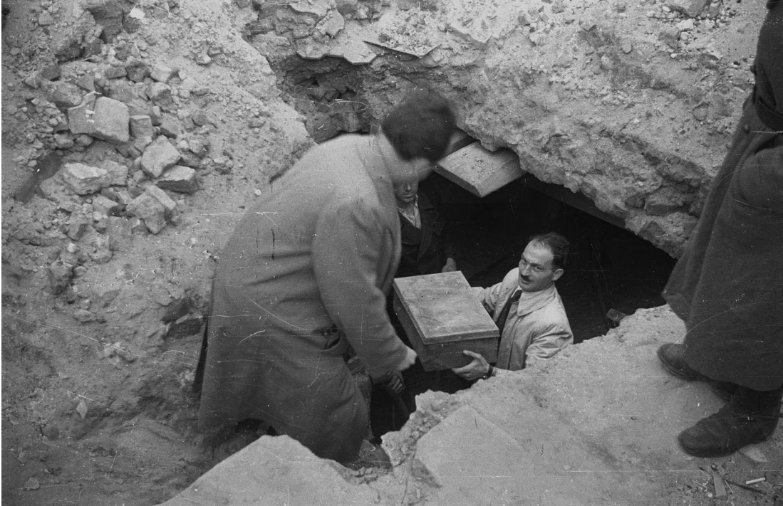
18. September 1946: In Kisten verwahrte Manuskripte und Dokumente des Ringelblum-Archivs werden aus den Trümmern des Warschauer Ghettos geborgen.