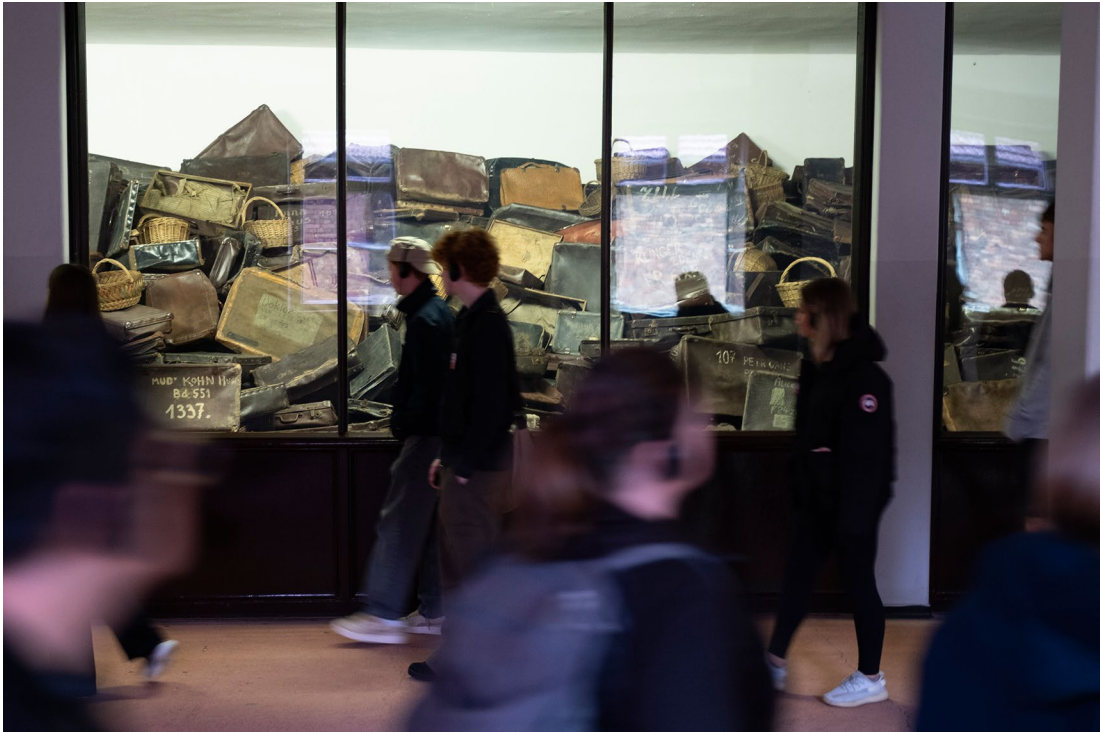
Gepäckstücke von Lagerinsassen in der Ausstellung der Gedenkstätte Auschwitz-Birkenau