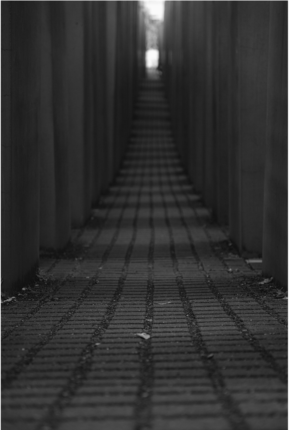
Denkmal für die ermordeten Juden Europas in Berlin, 29.9.2024