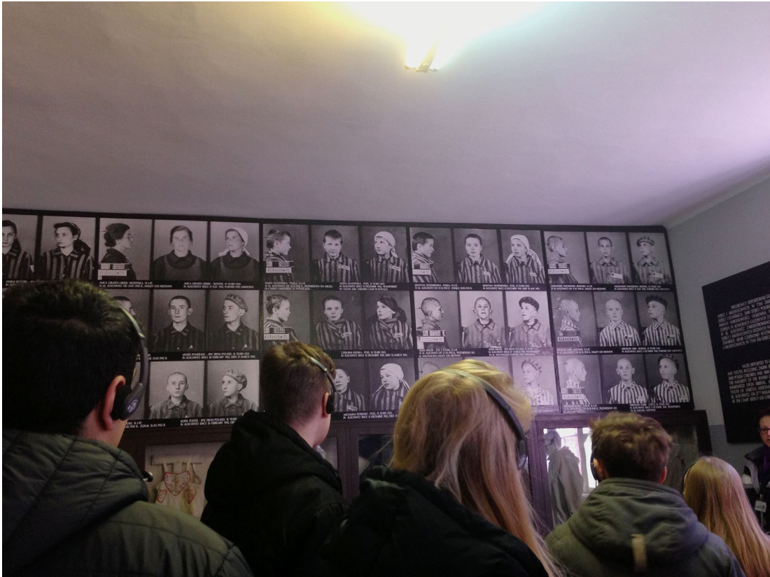
Porträtaufnahmen früherer Häftlinge in den Baracken des Lagers I