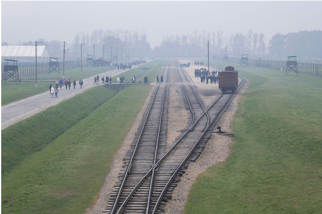
Selektionsrampe in Auschwitz-Birkenau