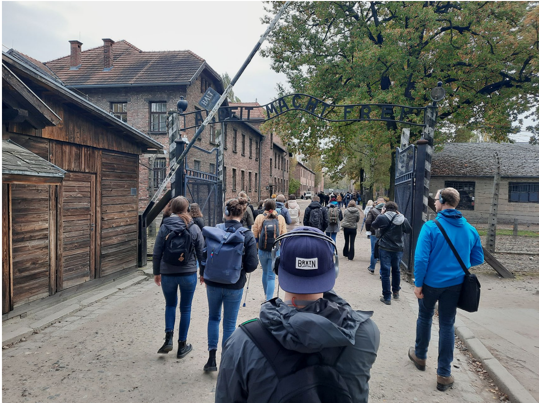
Schülerinnen und Schüler am Eingang zur Gedenkstätte des Stammlagers